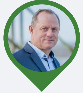
Secrétaire Maire de Chatelaillon