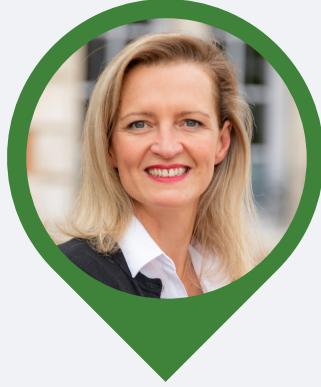
Vice présidente Présidente du département Maire de Fouras