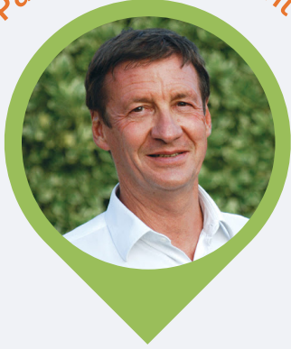
Président Maire de Bourgneuf