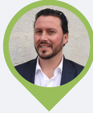
Trésorier Maire des Gonds