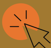
Table ronde : désherbage

Le 21 mai, nous avons organisé un webinaire avec l'intervention de l'ADEME et d'Aides Territoires.